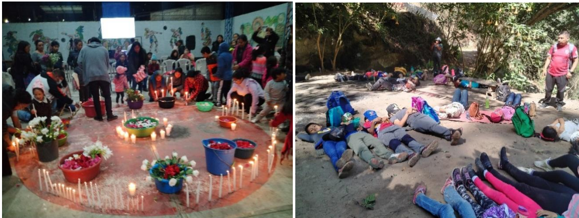
Ejercicios espirituales y salud mental desde la ecología.