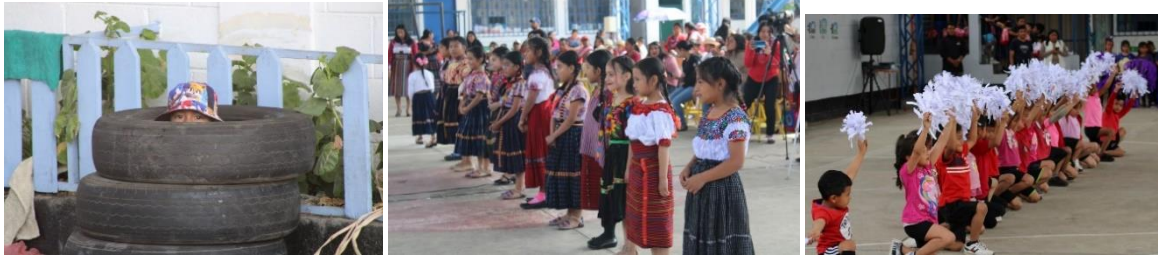
Diversas actividades sociales, culturales, deportivas, recreativas.