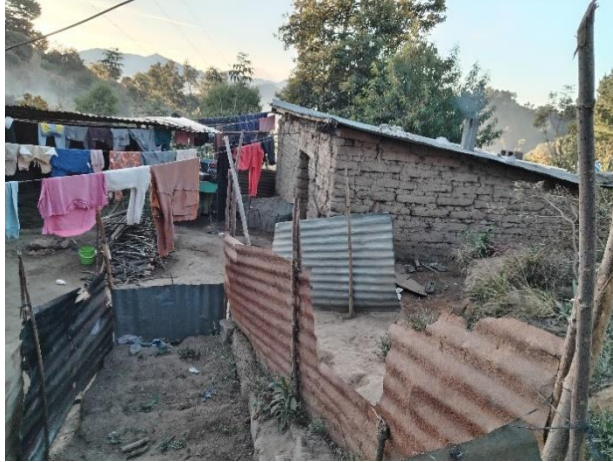
Vivienda típica de las comunidades de donde vienen los niños que viven en la casa hogar