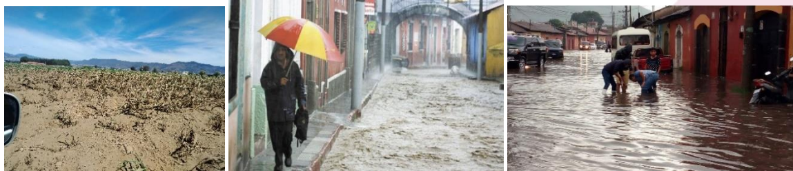
Dstrucción de la milpa por la sequía y calor; calles inundadas en el centro historico de Quetzaltenango y un parque principal inundado.

A nivel nacional hay factores climatológicos que afecta al país. En los primeros meses del año se tuvo climas bajo cero (Celsius) que afectó la salud de muchos niños, posteriormente cambió radicalmente a meses de extremo calor y sequía que afectó el crecimiento de la milpa y otras cosechas. En el mes de junio son intensas lluvias que está afectando la cosecha, la salud, daños en infraestructura. El precio del maíz subió un 50% con relación al precio de enero 2024. El maíz es la nutrición fundamental para las familias.